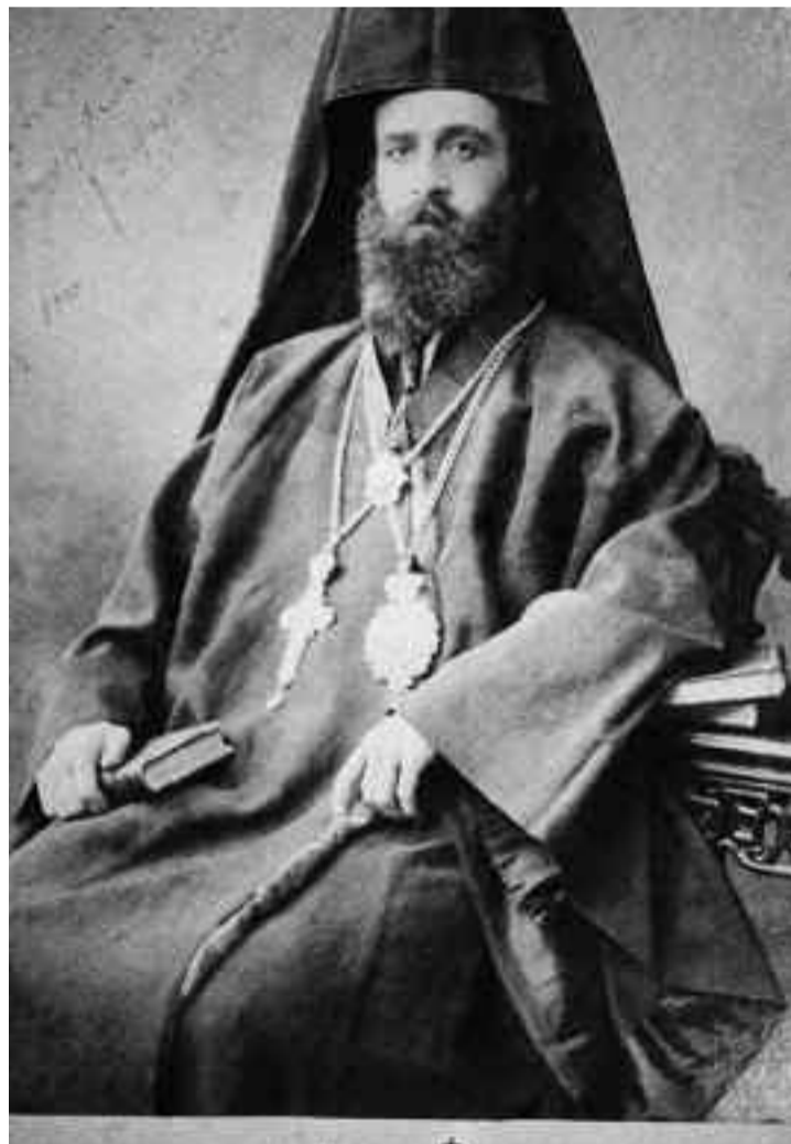
Ο Γερμανός Καραβαγγέλης ως επίσκοπος Χαριουπόλεως.

δύναμεις, με το ζήτημα της Δημοκρατίας του Πόντου, παρενέβη σε όλα. Μέχρι που τον συλλάβανε οι Νεότουρκοι, πήγε φυλακή και τον αποφυλάκισε το Πατριαρχείο. Απλώς, όταν έγιναν οι σφαγές στον Πόντο, ο μητροπολίτης Γερμανός δεν ήταν εκεί, βρισκόταν στην Κωνσταντινούπολη για μια σύνοδο. Αλλά και ο πρωτοσύγκελός του στην Καστοριά, ο Αίβαζίδης, που τον απαγχόνισαν πάνω από 70 ετών γέροντα.