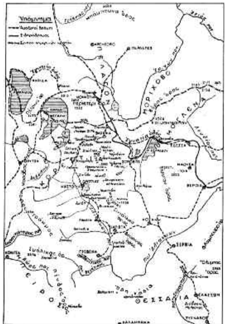
Χάρτης της Δυτικής Μακεδονίας το 1904.