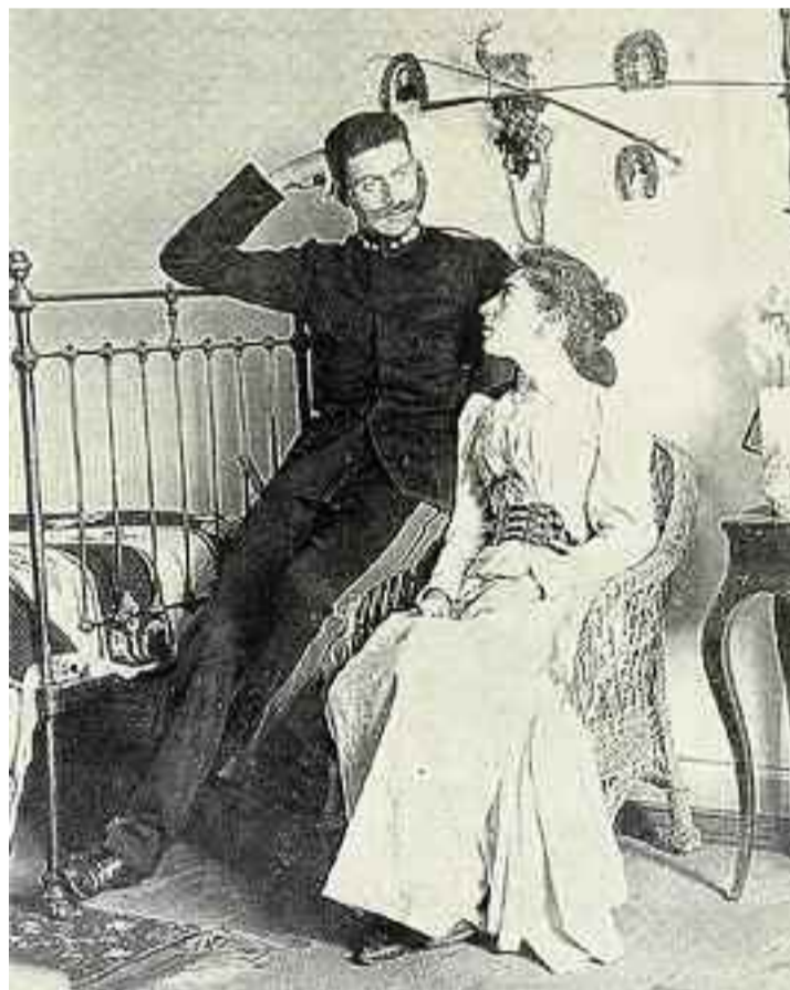
Ο Παύλος Μελάς με τη σύζυγό του Ναταλία, το γένος Δραγούμη.

Τα χρέη των συγγενών του αιμνήστου πρωτομάρτυρος είχαν το ατύχημα να εκτελέσω εγώ. Τη 23η του απαισίου μηνός μετέφερον επί κραβάτου εις την πόλιν ημών ο στρατός το ιερόν του πολυκλαύστου μας εθνομάρτυρος. Είναι αδύνατον να περιγράψω ενταύθα την άλγιστον και ζοφώδη εκείνην ψυχολογικήν στιγμήν. Μικρού δειν έπιπτον λιπόθυμος εν τω Διοικητηρίω και οι κρουνοί των δακρύων μου προύδοσαν εις τους πέριξ την ανεμοζάλην της κλονισθείσης ψυχής μου. Συνελθών εκ της αποτόμου σκοτιδινιάσεως