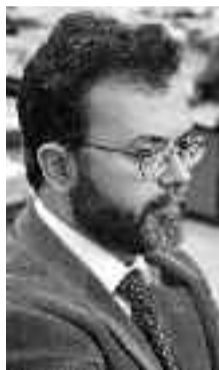
Ο Βασίλης Γούναρης.

1895 - η Εσωτερική Μακεδονική Οργάνωση και το Ανώτερο Κομιτάτο. Τα δύο αυτά κομιτάτα, τα οποία ιδρύθηκαν από Βουλγαρομακεδόνες, είχαν σκοπό ακριβώς την προώθηση της απόσπασης της Μακεδονίας από το τουρκικό κράτος. Μολονότι υπεισέλθαν και σοσιαλιστικοί στόχοι στην πολιτική τους, στην πραγματικότητα το όχημα εξακολουθούσε να είναι η αποσύνδεση των πλη-