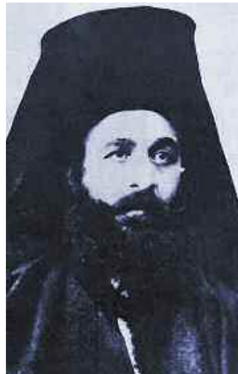
Ο μητροπολίτης Καστοριάς Γερμανός.