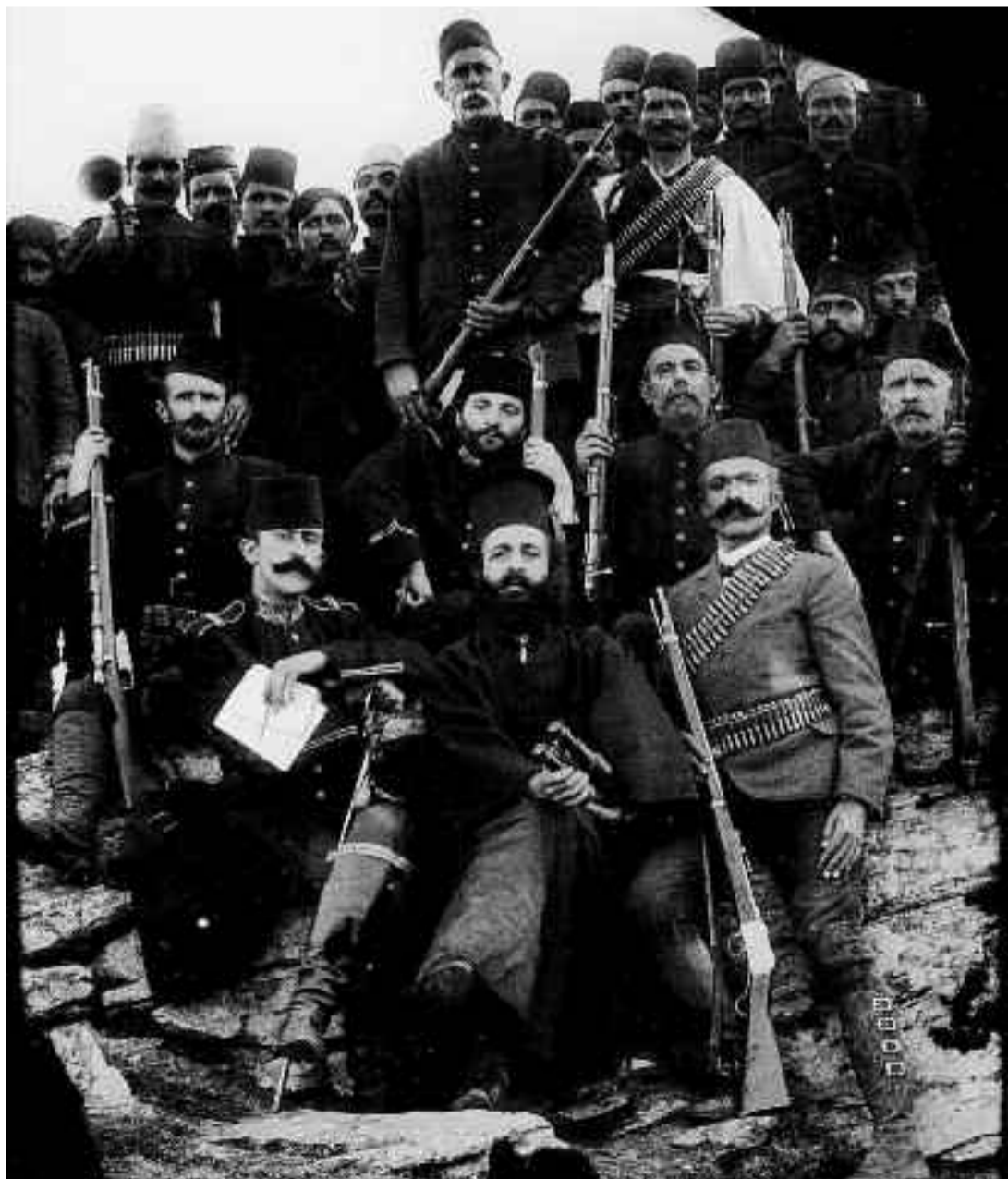
Ο μητροπολίτης Γερμανός Καραβαγγέλης με τούρκους αξιωματικούς και στρατιώτες.

Ανάμεσα στις πρώτες του ενέργειες ήταν να δει ποια ήταν η στάση του ελληνικού κράτους. Έτσι, αποτάθηκε στο προξενείο στο Μοναστήρι, και διαπίστωσε ότι οι μεν πρόξενοι τον υποστήριζαν, το δε κράτος τη δεδομένη στιγμή ήταν αδύνατο να αναλάβει οποιαδήποτε πρωτοβουλία, οπότε ο ίδιος κινήθηκε στο να προσελκύσει ντόπιους οπλαρχηγούς, αποσπώντας στελέχη από την αντίπαλη παράταξη. Αυτό έκανε. Μετά άρχισε να γράφει και να έρχεται σε επαφή ιδιωτικά με τους κύκλους των Ελληνομακε-