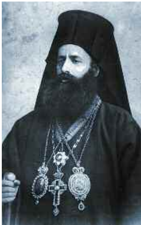
Ο μητροπολίτης Μοναστηρίου Ιωακείμ Φορόπουλος.