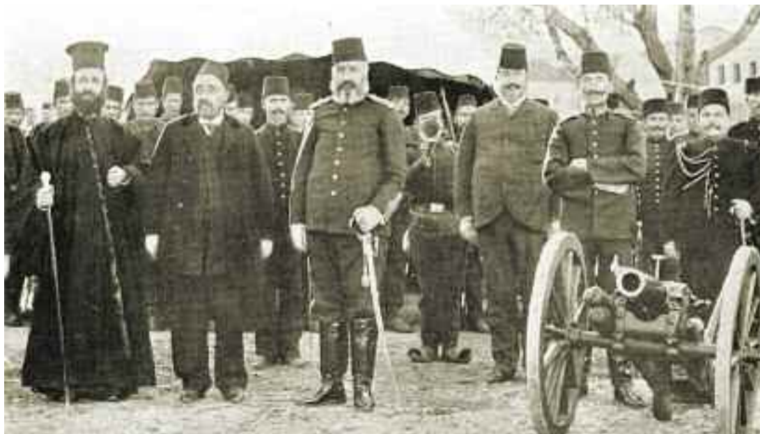
Ο μητροπολίτης Γερμανός με τούρκους στρατιωτικούς.

Πάντως, μπορεί κάποιος να πει πως οι υπηρεσίες του στη Μακεδονία ανταποδόθηκαν. Δηλαδή διασώθηκε η φήμη του χάρη στη Μακεδονία, αλλά και ο ίδιος δεν της είχε προσφέρει λιγότερες υπηρεσίες.