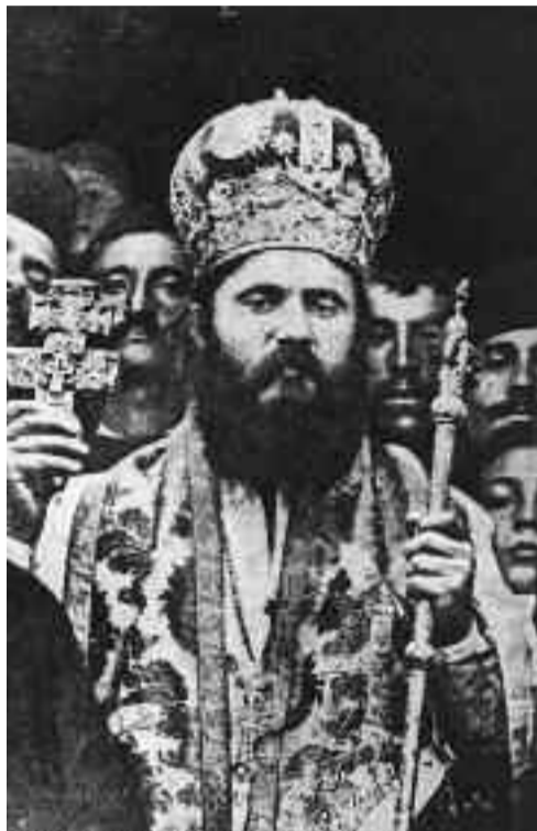
Ο μητροπολίτης Δράμας Χρυσόστομος Καλαφάτης, μετέπειτα μητροπολίτης Σμύρνης.

Στην εθναρχία και την εθναρχική συνείδηση κυρίαρχο στοιχείο είναι η θρησκευτική πίστη. Η Εκκλησία στην εθναρχία έχει θρησκευτικές αλλά και πολιτικές αρμοδιότητες, γι' αυτό και διευθετεί ζητήματα γάμου, διαζυγίων, υιο-