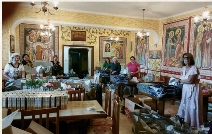
Οἱ συνεργάτιδες τῆς Ἀδελφότητας ἐπί τό ἔργον.

Οἱ κυρίες τῆς Ἀδελφότητας ἔσπευσαν μέ πολλή χαρά νά ἐτοιμάσουν τίς 300 περίπου τσάντες (μία γιά τόν κάθε κρατούμε- νο) πού περιείχαν τά παρα- πάνω εἶδη.