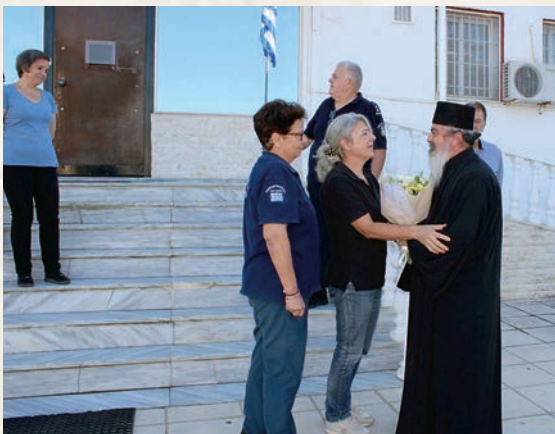
Προσφορά άνθοδέσμης έκ μέρους του προσωπικού.

Όλα αυτά δικαιολογήθηκαν, όταν κατόπιν μās έδειχναν τούς ζηλευτά ανακαινισμένους χώρους τής φυλακής, λέγοντάς μας: «Έπρεπε