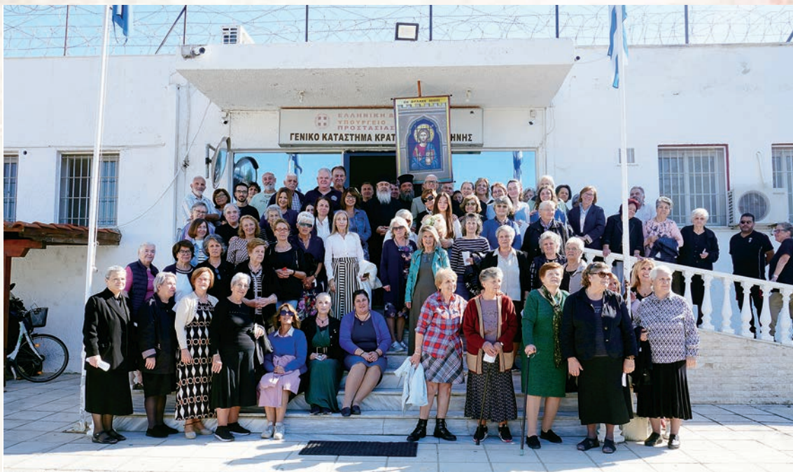
Στήν είσοδο τής Φυλακής Κομοτηνής.

ὁ π. Οἰκουμένιος, ὁ ὁποῖος ἔρχεται συχνά καί μπορεῖτε νά ἐξομολογεῖστε καί νά συμμετέχετε στή Θ. Λειτουργία.