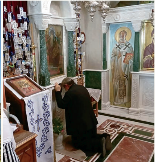
Μπροστά στήν Παντάνασσα.

ρό περίβολο καί γευτήκαμε τήν ἀπλόχερη φιλοξενία τῶν πατέρων τοῦ ἀγιορείτικου Μετοχίου, συνεχίσαμε τόν δρόμο τῆς ἐπιστροφῆς στή Θεσ/νίκη προγραμματίζοντας ἤδη τήν ἐπόμενη ἐξόρμησή μας.