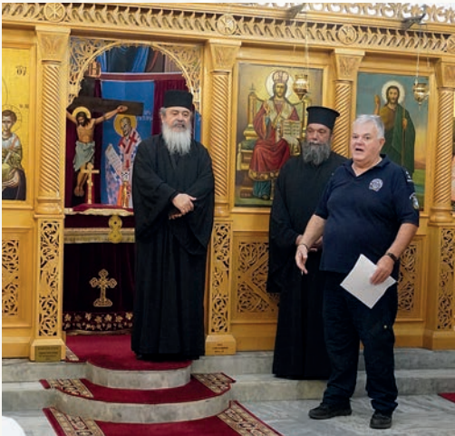
Στό ἐκκλησάκι τοῦ Ἁγίου Ἐλευθερίου μέ τόν π. Οἰκουμένιο καί τόν Ἀρχιφύλακα.

λίτου γιά τούς κρατούμενους. Ὁ π. Οἰκουμένιος, ὁ ὁποῖος λειτουργεῖ στό ναό τῆς φυλακῆς καί ἐξυπηρετεῖ τίς πνευματικές ἀνάγκες τῶν κρατουμένων, ἀπευθύνθηκε στούς ἐπισκέπτες λέγοντας ὅτι ὁ Σεβασμιώτατος Μητροπολίτης Μαρωνείας καί Κομοτηνῆς κ. Παντελεήμων, μόλις ἔμαθε γιά τήν ἐπίσκεψή μας, τόν ἔστειλε ὡς ἐκπρόσωπό του, γιά νά μᾶς μεταφέρει τίς ἐγκάρδιες εὐχές του .