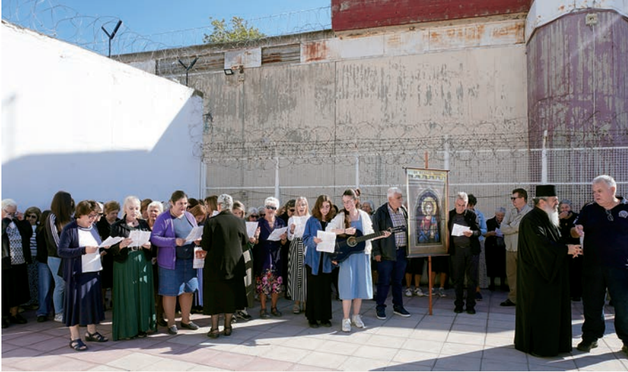
Ψυχαγωγία στους κρατούμενους με χριστιανικά τραγούδια.

Θεός δέν ἀπορρί- πτει κα- νέναν, ἀλλά μᾶς περιμέ- νει ὅλους νά ἐπιστρέ- ψομε κοντά Του.