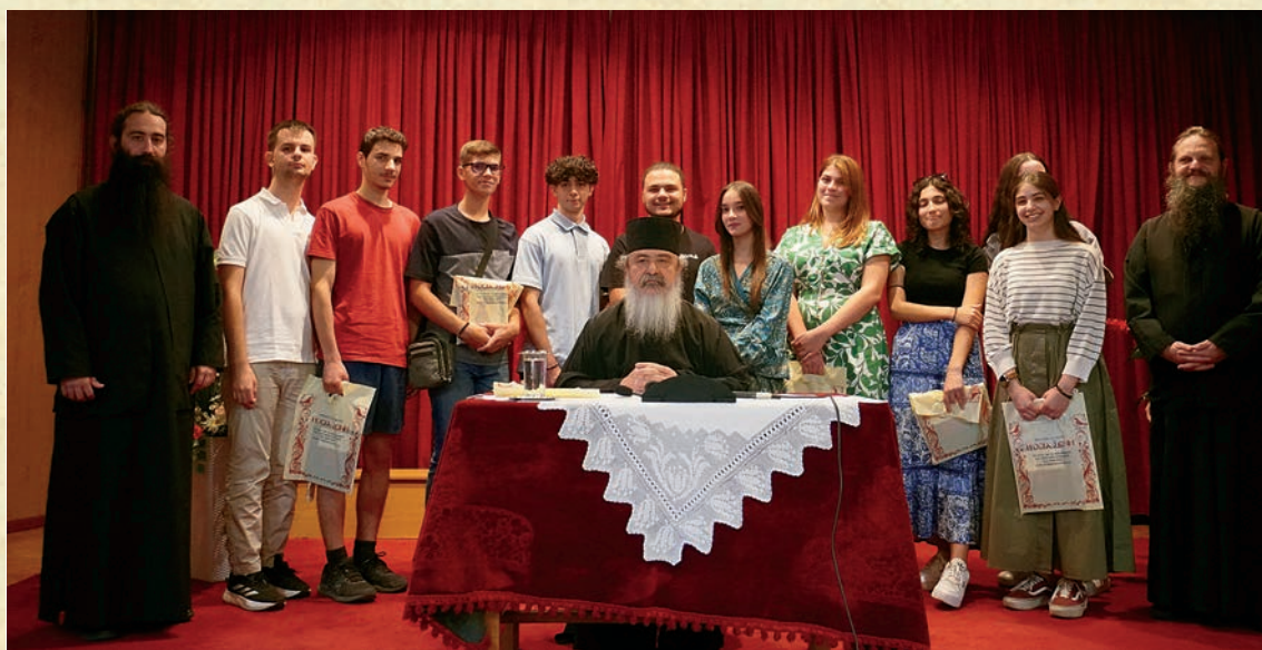
Συγχαρητήρια στα παιδιά μας που πέτυχαν στις Πανελλαδικές Έξετάσεις!