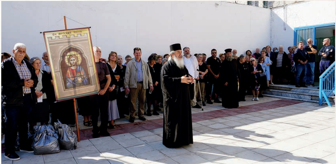
Οἱ ἐπισκέπτες-συνεργάτες τῆς Διακονίας- πλαισιώνουν τόν Γέροντα κατά τήν ὁμιλία του στούς κρατούμενους.

Στή συνέχεια περάσαμε στούς δύο χώρους, ὅπου αὐλίζονται οἱ