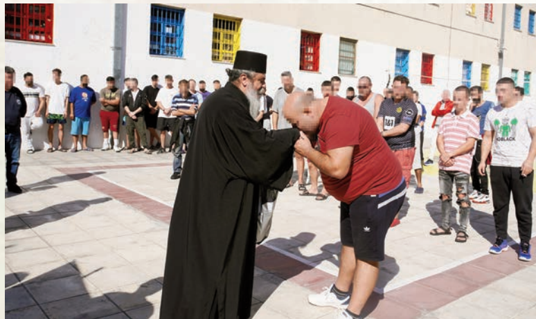
Ἡ γλώσσα τῆς ἀγάπης μιλάει βαθιά στίς ψυχές.

ἐμεῖς ἐδῶ μαζί με τόν Ἀρχιφύλακα καί τούς Διευθυ- ντές τῆς Φυ- λακῆς καί ὅλους τούς ὑπαλλή- λους, πού τούς ἀγαπήσαμε, μᾶς ἀγάπησαν καί κάναμε πολλά ὄντως ἐδῶ μέ πολλή ἀγάπη. Ἦρθαμε σήμερα γιά νά σᾶς ξανα- δοῦμε καί νά