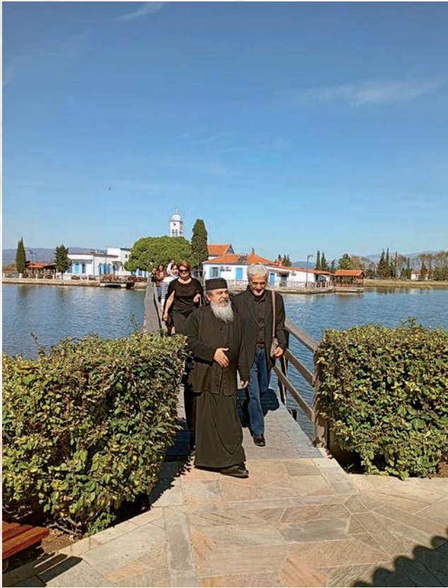
Πόρτο Λάγος. Στο βάθος τό ἐκκλησάκι τῆς Παντάνασσας.