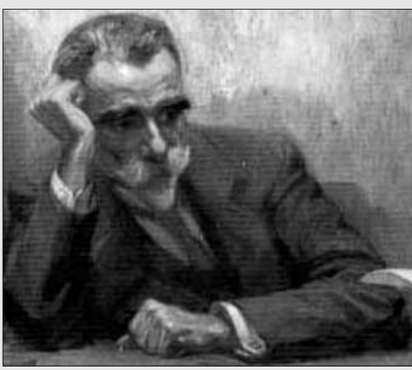
«Οι Ολυμπιακοί αγώνες γέννησαν τους Μαραθώνες και τους Παρθενώνες»