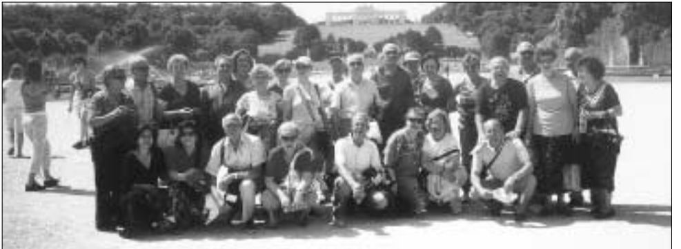
Βιέννη: Στους κήπους των Ανακτόρων του Σένμπρουμ.

Είναι μια υπέροχη πόλη, που φωλιάζει σε μια γραφική κομψή του ποταμού Μολδάβα, χτισμένη με βάση τη γοτθική και την μπαρόκ αρχιτεκτονική. Ο Γκαίτε έλεγε ότι η