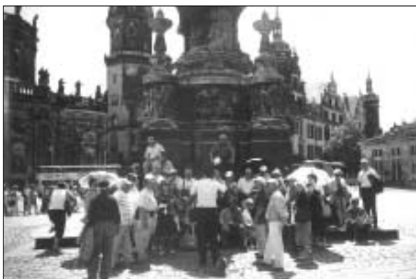
Δρέσδη: Πλατεία Ανακτόρων.

Το βραδινό πρόγραμμα περιελάμβανε, προαιρετικά, παράσταση Μαύρου Θεάτρου με το περίφημο έργο Aspects of Alice (γνωστό στην Ελλάδα ως «η Αλίκη στη χώρα των θαυμάτων») της παγκοσμίου φήμης συγγραφέως LEWIS CARROL σε κεντρικό θέατρο, με 7μελές συγκρότημα. Όσοι από εμάς είχαμε την τύχη να παρακολουθήσουμε την παράσταση, ταξιδέψαμε πάνω στα φτερά της παιδικής φαντασίας σε χώρες καμωμένες από την ακλή του παραμυθιού και τα υφάδια του μύθου, γιατί κανένα παιδί δεν έχει χάσει το υπέροχο αυτό ανάγνωσμα, όπου τα όνειρα των παιδικών χρόνων πλέκονται με τα μυστικά υφάδια της μνήμης.