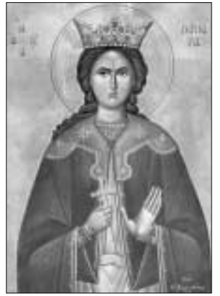
Η ΑΓΙΑ ΒΑΡΒΑΡΑ “ΣΩΖΟΙ ΤΟ ΠΥΡΟΒΟΛΙΚΟΝ”

ΤΡΙΜΗΝΙΑΙΑ ΕΦΗΜΕΡΙΔΑ ΤΟΥ ΣΥΝΔΕΣΜΟΥ ΑΠΟΣΤΡΑΤΩΝ ΑΞΙΩΜΑΤΙΚΩΝ ΠΥΡΟΒΟΛΙΚΟΥ ΤΟΥ ΕΛΛΗΝΙΚΟΥ ΣΤΡΑΤΟΥ