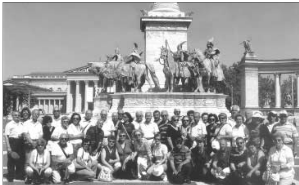
Βουδαπέστη: Πλατεία Ηρώων.

κή Ριγκοτράσε με τα καταπληκτικά κτίρια και στη συνέχεια την Κρατική Όπερα, το Αυστριακό Κοινοβούλιο, το ιστορικό Πανεπιστήμιο και το αυστηρό συγκρότημα των ανακτόρων Χόφμπουργκ. Είδαμε ακόμη την περίτεχνη Βοτιθκίρχε, το ανάκτορο Μπελβεντέρε, εξαιρετικό δείγμα Αυστριακού μπαρόκ και τέλος επισκεφθήκαμε το παλάτι Σέμπρουμ, όπου θαυμάσαμε ορισμένα από τα 1200 δωμάτιά του. Στον ελεύθερο χρόνο μας επισκεφθήκαμε τα κομψά καταστήματα του Γκρόμπεν και της Κερντερστράσε.