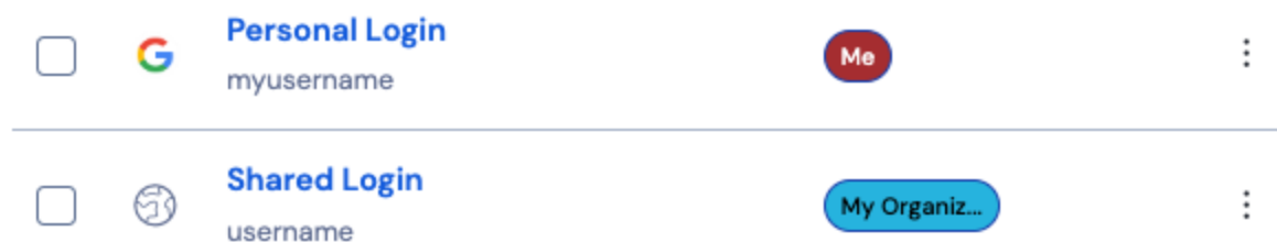
Icono de elemento compartido

Crear un elemento compartido establecerá la propiedad a la organización . Esto significa que cualquier persona con permiso puede alterar el elemento o eliminarlo, lo que también lo eliminaría de tu caja fuerte. Puedes saber que un elemento es compartido por la tarjeta junto a su nombre: