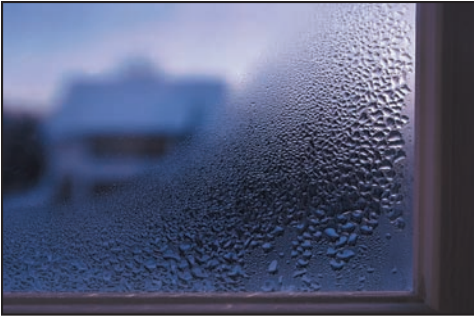
Condensación en el interior del vidrio de la ventana.