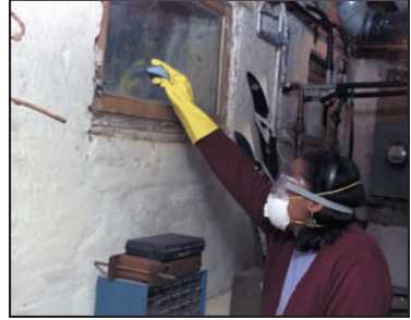
Persona limpiando con respirador N-95, guantes y gafas de protección.