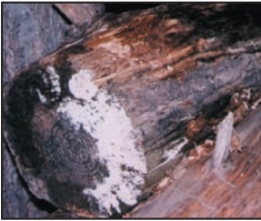
Moho creciendo sobre leña al exterior. Los mohos tienen varios colores, esta foto enseña ambos mohos blanco y negro.

Los mohos forman parte del medio ambiente natural. Al exterior, los mohos juegan un papel en la naturaleza al desintegrar materias orgánicas tales como las hojas que se han caído o los árboles muertos. No obstante, al interior, es necesario evitar el moho. Los mohos se reproducen mediante esporas; las esporas son invisibles a simple vista y flotan en el aire exterior e interior. Las esporas de mohos se hallan normalmente presentes en el aire exterior e interior. El moho puede crecer al interior cuando las esporas