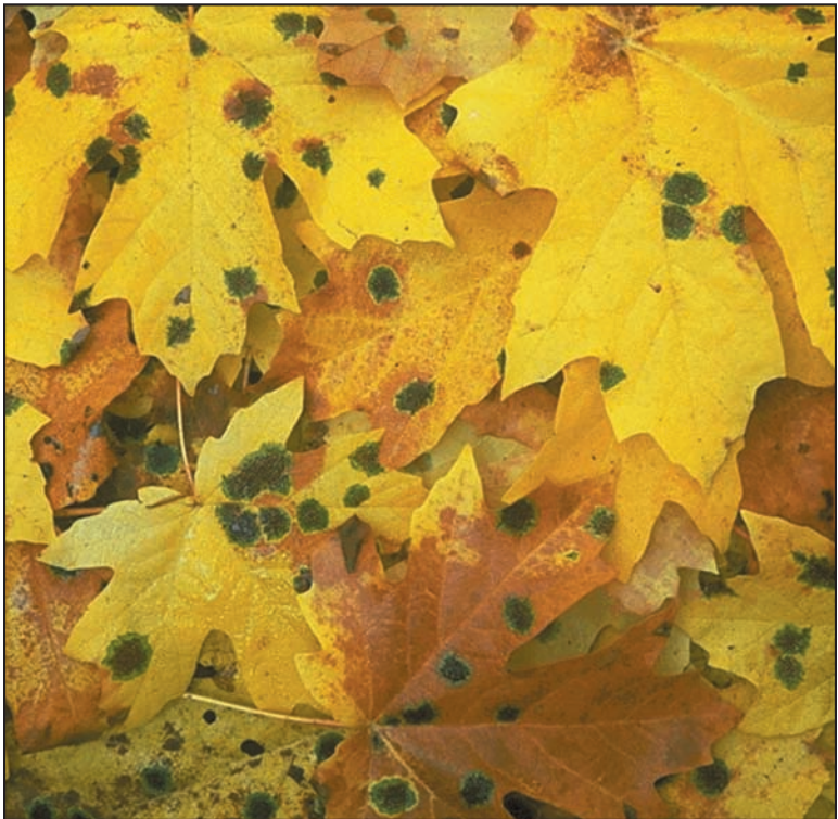
Moho creciendo en hojas caídas.

Se puede obtener este documento del sitio Web de la División para Medio Ambientes Interiores, EPA en www.epa.gov/mold