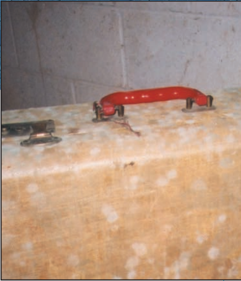
Moho creciendo en una maleta guardada en un sótano húmedo.

Es importante tomar precauciones que limiten su exposición al moho y a las esporas de moho.