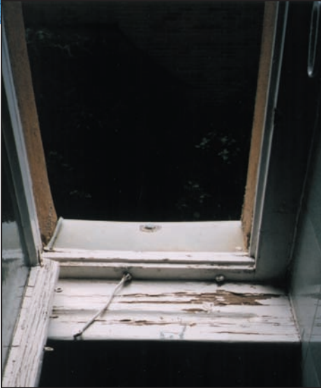
Ventana con fugas - el moho está empezando a crecer en el marco de madera y en el apoyo de la ventana.

Si ya tiene un problema con el moho — ACTÚE RÁPIDAMENTE.