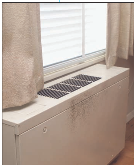
Moho creciendo sobre la superficie de un ventilador.