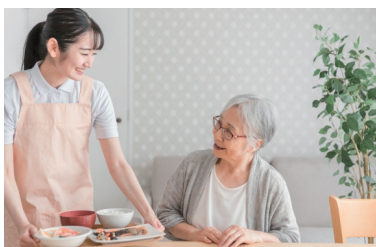
高齢者・療養中の方に