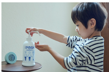
手洗いトレーニング中のお子さんに