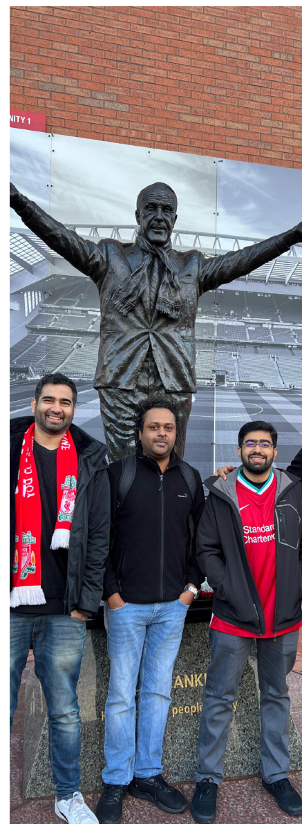
La foto di rito dinanzi alla statua di Bill Shankly, sita di fronte alla Kop