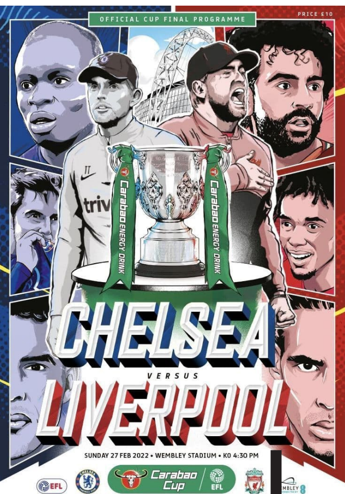
Il matchday programme della partita