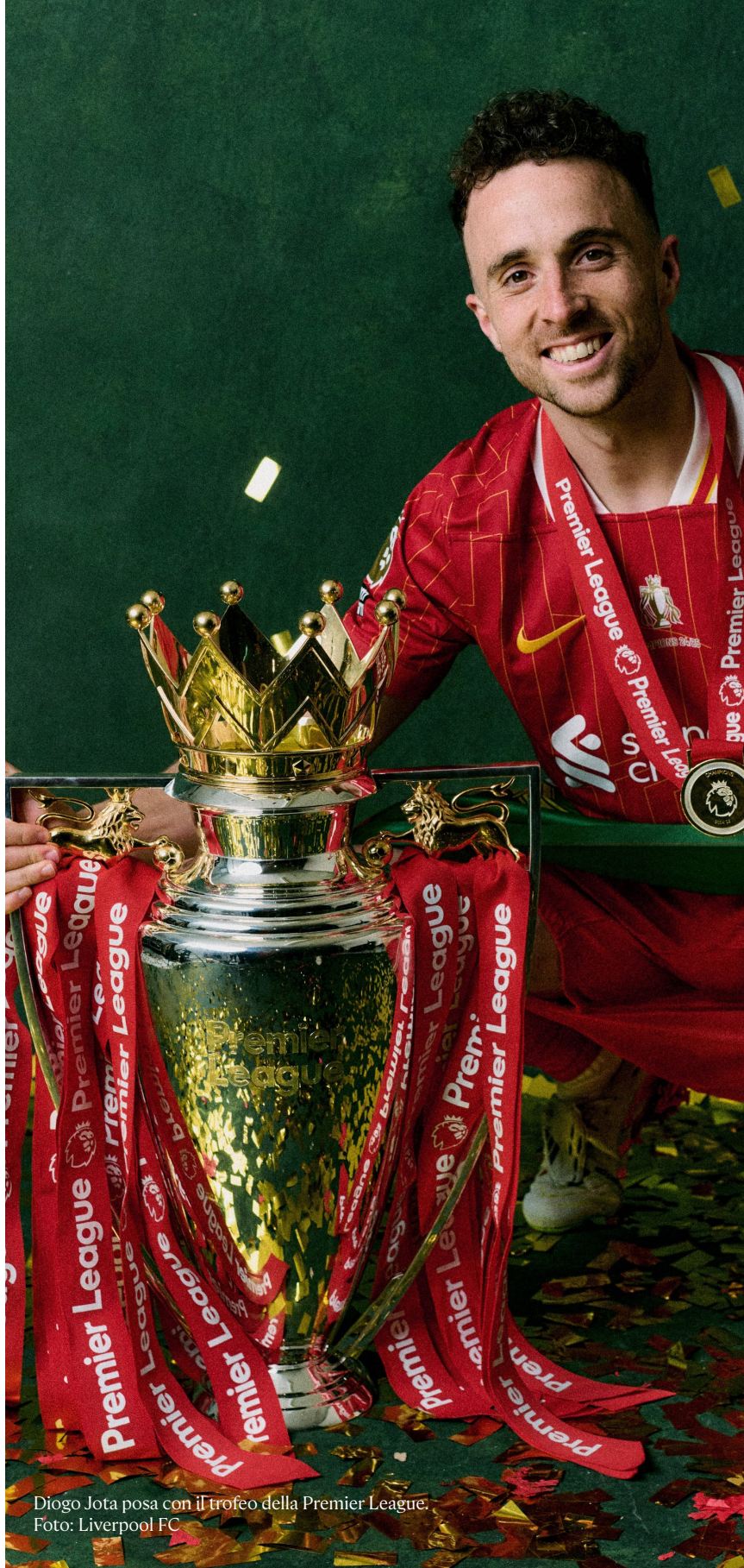
Diogo Jota posa con il trofeo della Premier League.