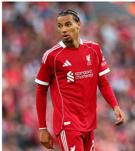
Hugo Ekpitke è stato acquistato per 79 milioni di sterline (bonus inclusi)

E già così si capisce come questi investimenti mostruosi non hanno sballato l'equilibrio finanziario del club di Anfield né l'abbiano portato a trasgredire le regole del fair play. Il mercato non basta però a spiegare come il Liverpool non solo sia considerato una squadra che non ha problemi di PSR, ma addirittura una in attivo e in grado senza problemi di spendere mezzo miliardo di euro in una sola sessione di mercato. I Reds la scorsa stagione hanno incassato 296 milioni tra premi per la vittoria della Premier League e il cammino in Champions League, chiuso sì agli ottavi di finale ma dopo aver dominato la fase a gironi. Da questa stagione incassano circa 70 milioni l'anno da Adidas e con l'ampliamento di Anfield da 54mila a 61mila spettatori lo stadio promette di produrre incassi da 6 milioni di euro per ogni partita di cartello. Inoltre da questa stagione entrerà in vigore in Premier League un nuovo accordo per i diritti TV in Gran Bretagna che oltre a far passare il totale di partite trasmesse in TV da 200 a 270 promette di aumentare di molto quello che ciascuna squadra incassa. Nell'ultima stagione di cui disponiamo delle cifre esatte, il 2023-24, i Reds hanno incassato 233 milioni di euro. Mettere insieme queste cifre, a cui si aggiunge la potenza globale del marchio Liverpool in termini di merchandising, spiega bene perché il Liverpool abbia prodotto utili im-