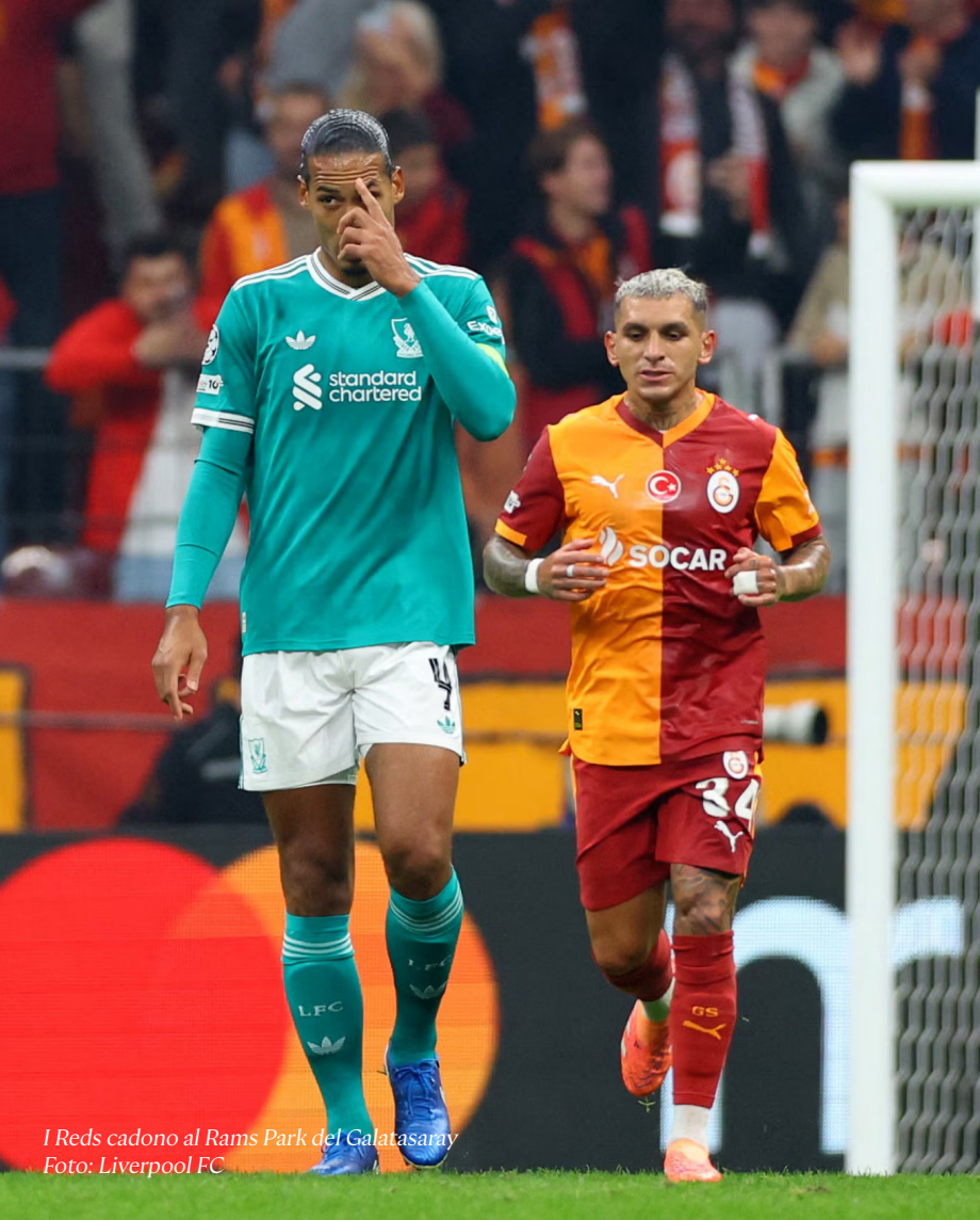
I Reds cadono al Rams Park del Galatasaray