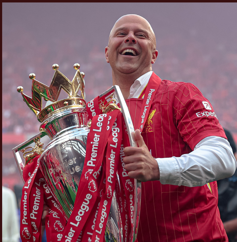
Arne Slot ha guidato i Reds al titolo alla sua prima stagione