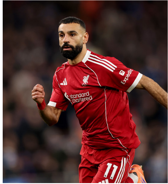
5 reti in 20 partite per il numero 11 in stagione

il compagno) continua a non essere da escludere la sua fuga a gennaio, destinazione Arabia Saudita. Uno scenario che al momento sembra non così probabile, ma le offerte non mancano. Salah sarebbe l'uomo immagine perfetto - lui musulmano - per quella lega. Se poi vi arrivasse come trionfatore con l'Egitto della Coppa d'Africa ancora meglio. Secondo scenario, gioca nel Liverpool fino a giugno aiutando i Reds a tornare in Champions League e, perché no, a vincere anche qualcosa e poi se ne va, pur avendo ancora un anno di contratto. I media di Liverpool parlano persino di un accordo, orale, già fatto tra il club e Salah per chiudere così la splendida esperienza del giocatore in riva alla Mersey. E poi c'è il lieto fine, che nelle favole non manca mai: Salah gioca fino a fine contratto, vince qualche altro trofeo e se ne va con l'onore anche di una partita d'addio, osannato da tutti. Slot compreso... Il secondo dei tre scenari sembra il più probabile.