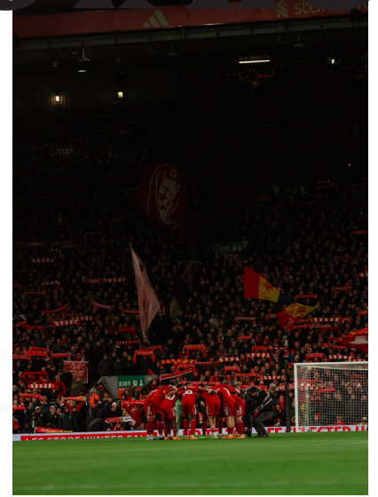
Alla squadra è mancata la solidità di Anfield

terra con i due pareggi deludenti contro Sunderland e Leeds. Non posto in classifica a -10 dall'Arsenal e Premier League di fatto compromessa. Il periodo di crisi nera è stato caratterizzato inequivocabilmente da un disastro difensivo, con 25 goal subiti in 13 partite, di cui la metà ad Anfield, una volta fortino inespugnabile. Quello che però balza all'occhio da una valutazione più profonda è che la squadra non ha mai saputo dare continuità alle poche volte in cui è riuscita a tirarsi su dalle sabbie mobili, anzi la caduta è stata ancora più pesante. Basti pensare che dopo il poker di sconfitte iniziale è arrivato un roboante successo per 5-1 a Francoforte, a cui però hanno fatto seguito la sconfitta di Brentford e il sonoro 3-0 subito in casa dal Crystal Palace nel match di coppa. Squadra che si rilancia con due successi di valore, come detto, contro Villa e