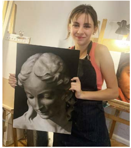
JUANCI 15 AÑOS - OBRA COLOR - MEL 32 AÑOS PINTURA MONOCROMA - MONSERRAT 16 AÑOS ÓLEO MONOCROMO