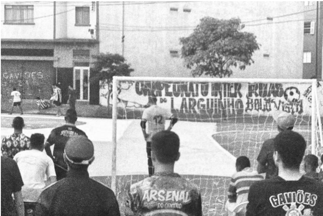
Figura 6 - Futebol em campeonato no largo Maria José, 2019

Na mesma entrevista, Jorge diz: "Quem só passa de carro não conhece nada daqui, agora quem anda, circula, convive, é outra pegada". Aparece em sua fala a dimensão do circular e ser parte daquele lugar. Assim como outro morador, ele se refere ao Bairro como sua quebrada – a palavra aqui não tem um sentido negativo, nem diz respeito à localização: simboliza união, pertencimento. É similar em muitos aspectos à "região" tal como colocada por Frémont (1980), sinônimo de espaço vivido – visto, apreendido, sentido. Não alienado.