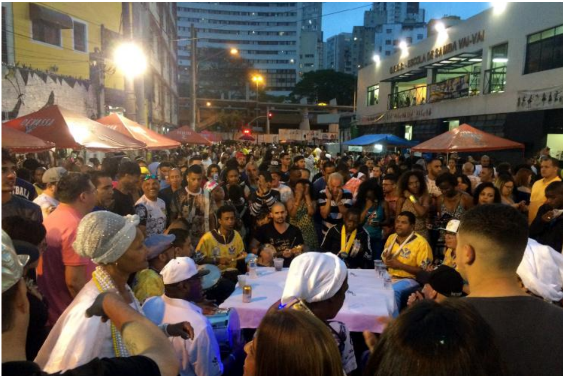
Figura 2 - Roda de compositores do Vai-Vai, entre as ruas São Vicente, Cardeal Leme, Lourenço Granato, avenida Nove de Julho, 2017.

ali desde a segunda metade do século XX e ainda pouco figuram na memória e no imaginário do Bairro, embora este também seja um processo que parece estar em transformação: em 2021 foi lançado o documentário "Oxente, Bixiga", sobre a migração nordestina ali. Segundo o Instituto Brasileiro de Geografia e Estatística (IBGE), houve um salto populacional entre 1950 e 1960 no distrito da Bela Vista, período que marcou a chegada de um grande contingente de cidadãos nordestinos a São Paulo.