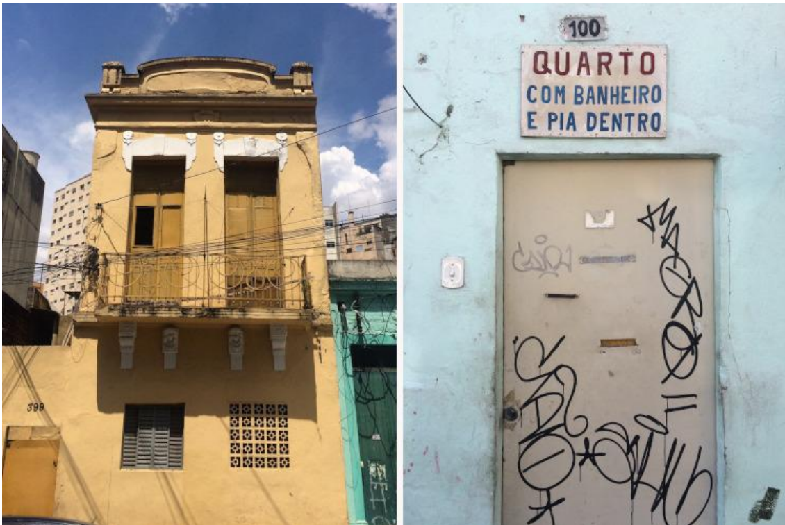
Figura 4 - Casa na rua Maria José (esquerda) e anúncio de quarto em pensão na rua Conselheiro Carrão, ruas bem próximas que se cruzam, 2019.

Um morador ouvido na pesquisa compara o Bairro a um mosaico. Foi bastante presente nos relatos, nas conversas travadas, a ideia de o Bexiga ser heterogêneo. O que daria uma liga, costurando esses pedaços, resultando na dimensão de bairro, seriam as características citadas que marcam sua identidade e são percebidas em algum grau nesses diferentes pedaços; as relações que se estabelecem; bem como a história do próprio local ainda presente e que se comunica por meio de instituições, atividades e festas – mesmo com mudanças no espaço, tais como a abertura de avenidas ou o alargamento de ruas. Ao contrário do distrito que tem seus limites bem definidos, é importante sublinhar que a noção de bairro abarca a dimensão social, mais subjetiva. Souza (1989) diz que: