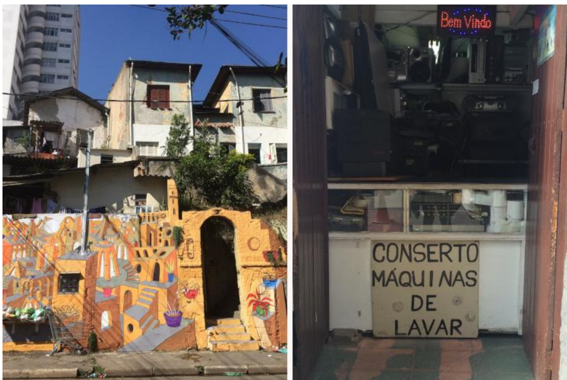
Figura 3 - Vila de casas na rua Almirante Marques Leão (esquerda) com edifício ao fundo na paisagem, 2017, e comércio na rua 13 de Maio (direita), 2018.

pobres, ocupados em grande parte pela população negra, são estereotipados, quando não criminalizados. Perseguição da polícia a moradores jovens negros também foi um aspecto colocado no depoimento de um morador. A boemia – muitos bares –, barulho constante de gente na rua e a necessidade de mais projetos sociais ainda se destacam nas conversas.